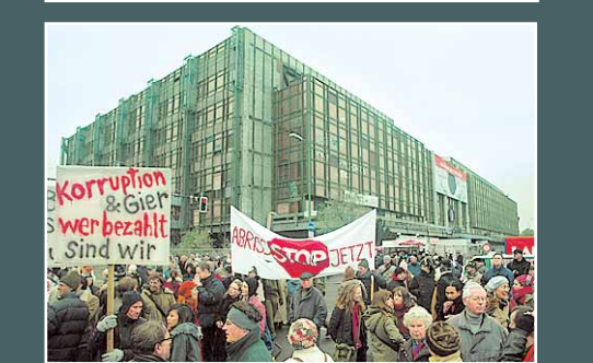
NOVEMBERKLAMM umhüllt die Demo den Palast, ihr Schutzobjekt

tene Engel, stürzende Menschen. Bilder gestorbener Greise, gemordeter Kinder. Der letzte Blick des geschächterten Schafs. Die Rettungsringe gescheiterter Schiffe. Ein leibloser Kopf schwimmt im Weiher. Wasser plätschert, Grillengezirp. Der Kopf singt Bach: Ich freue mich auf meinen Tod / ach hätte er sich schon eingefunden / entkomm ich aller Not / die mich noch auf der Welt gebunden. Und dann ins Helliglicht, Weiße. White Cube: ein gewaltiger Saal, zehn Meter hoch, strahlende Wärme, Lichtung der Nacht, Hausung inmitten des Untergangs.